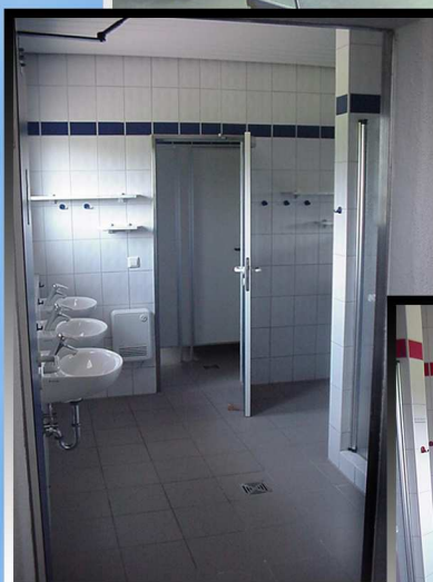
Sanitäranlage für Herren