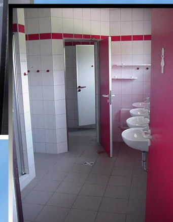
Sanitäranlage für Damen